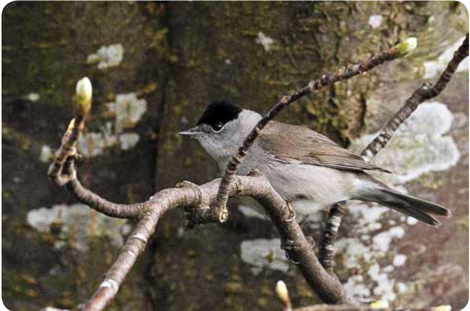
Svarthätta är en av de arter som återvänder tidigare år för år.

Från tidigare studier vid fågelstationen vet man vinterklimatet är en betydande faktor. Oavsett om övervintringen skett i Afrika eller Europa så anländer de flesta fågelarter tidigare efter milda och fuktiga vintrar.