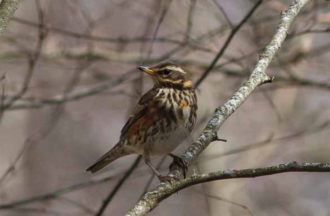
Rödvingetrast ( Turdus iliacus )